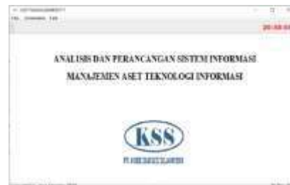
Gambar 2 : Tampilan Form Menu Utama

dan data perangkat lunak atau software. Dan juga pendataan inventaris IT dan pendataan permasalahan IT serta menu untuk keluar dari aplikasi.