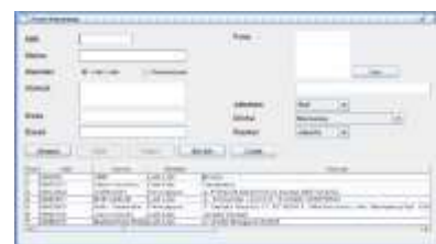
Gambar 3 : Form Data Karyawan Sumber: hasil penelitian

Di dalam form ini terdapat fasilitas untuk menyimpan data karyawan, bersihkan data karyawan dan tabel list data karyawan serta mencetak data karyawan dalam bentuk spreadsheet.