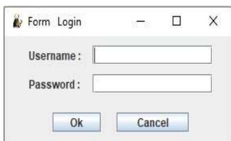
Gambar 1 : Tampilan Form Login

Form ini digunakan untuk keamanan sebelum masuk ke dalam sistem informasi manajemen aset teknologi informasi. Dimana pengguna harus memasukkan username dan password secara benar. Bila login berhasil maka akan ada pesan berhasil serta bisa masuk ke dalam form menu utama sistem informasi manajemen aset teknologi informasi.